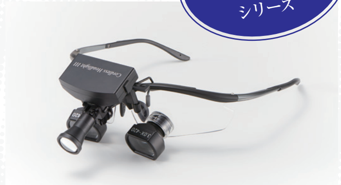
with Galilean Loupe UL Multi TTL ガリレアンルーペ UL TTL コードレスUVライトセットⅢ

一般名称: 双眼ルーペ 医療機器分類: 一般医療機器 届出番号: 13B2X10104100393