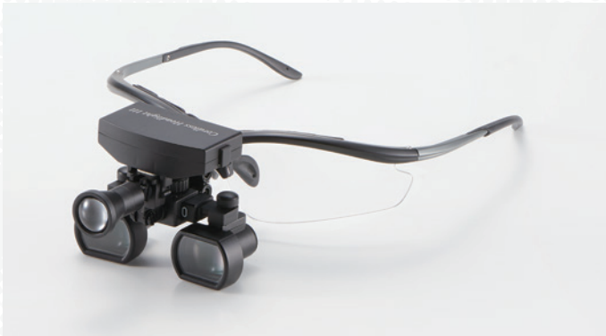
with Galilean Loupe UL Multi ガリレアンルーペ ULマルチ コードレスUVライトセットⅢ

■ Black (2.5倍/3.0倍) ■ Red (2.5倍/3.0倍) ■ Pink (2.5倍/3.0倍) セット価格 94,000円 セットで8,000円お得!