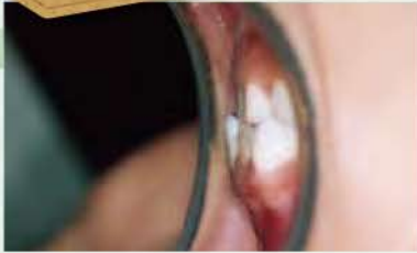
前歯の被蓋は反対咬合です