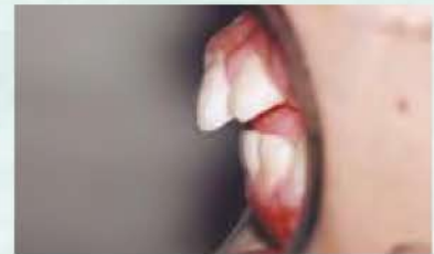
3分間トレーニングをした直後

タッチ・スティックを軽くくわえ、下顎のポスターを正常位に正します。 同時に舌をスティックの上のせてスポット(切歯乳頭部)へ押しつける訓練を3分間行いました。 下顎が前方に自然に移動しました。