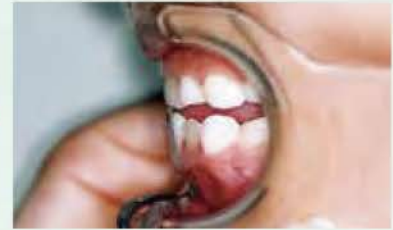
3分間、タッチ・スティックをくわえた後の咬合状態の変化

タッチ・スティックを3分間くわえたあと、自然に下顎は後退して反対咬合位から切端咬合位に移行します。 軽度の反対咬合、切端咬合のケースではタッチ・スティックにより正しい筋肉位を会得し、 トレーニングで正常咬合への改善が期待できます。