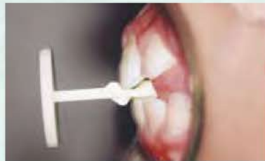
正常位用のタッチ・スティックをくわえた状態