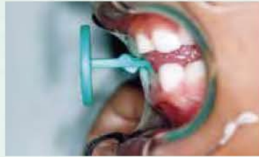
正常位用のタッチ・スティックをくわえた状態