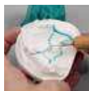
スタンダードトランスベアレント