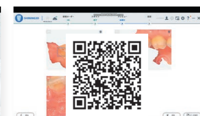
口腔内健康レポート