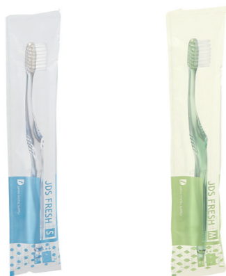
S(ソフト) M(ミディアム)

国産品で患者さんがお求めやすい価格の歯科医院専売歯ブラシです。ソフトとミディアムの2種類をご用意いたしました。