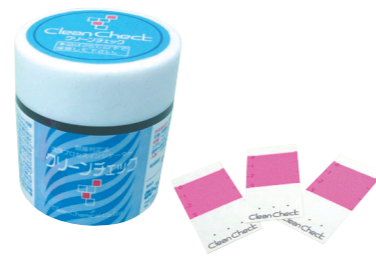
クリーンチェック