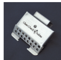
クリーンチェックホルダー

洗浄装置の稼働状況をチェックできるプロセスインジケータです。シートの色調によって、洗浄装置の洗浄力を確認できます。