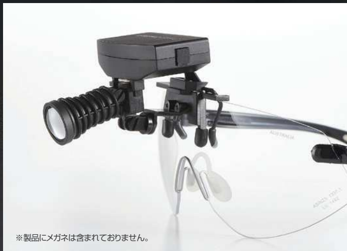
※製品にメガネは含まれておりません。