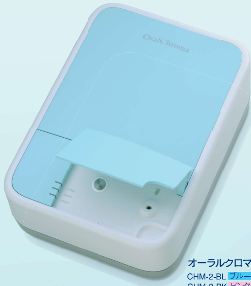
オーラルクロマ CHM-2-BL ブルー CHM-2-PK ピンク