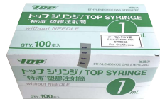
専用シリンジ 100本 希望医院価格 4,000円