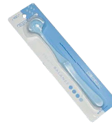
GC 舌フレッシュ 10本 希望医院価格 660円(1本あたり)