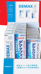
デマックス A 3種セット 希望医院価格 11,825円

○カタログに記載されている仕様及び外観は、予告なく変更されることがありますのでご了承下さい。 ○価格は希望医院価格です(価格に消費税は含まれておりません)。