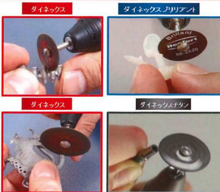
ダイネックス各種使用イメージ