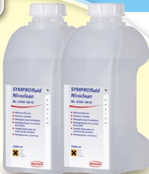
ニコチン洗浄液 ニコクリーン 2L×2本