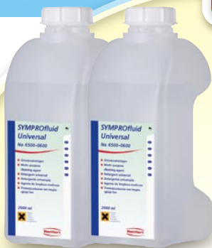
シンプロ専用洗浄液 ユニバーサル 2L×2本