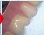
回転数2000RPM 洗浄時間30分間